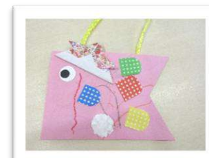
『こいのぼりバッグ』です