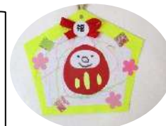
だるまさん絵馬です