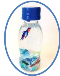
水族館ボトルです