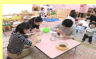
植育かわれえすプラウト