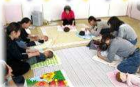
ベビー マッサージ