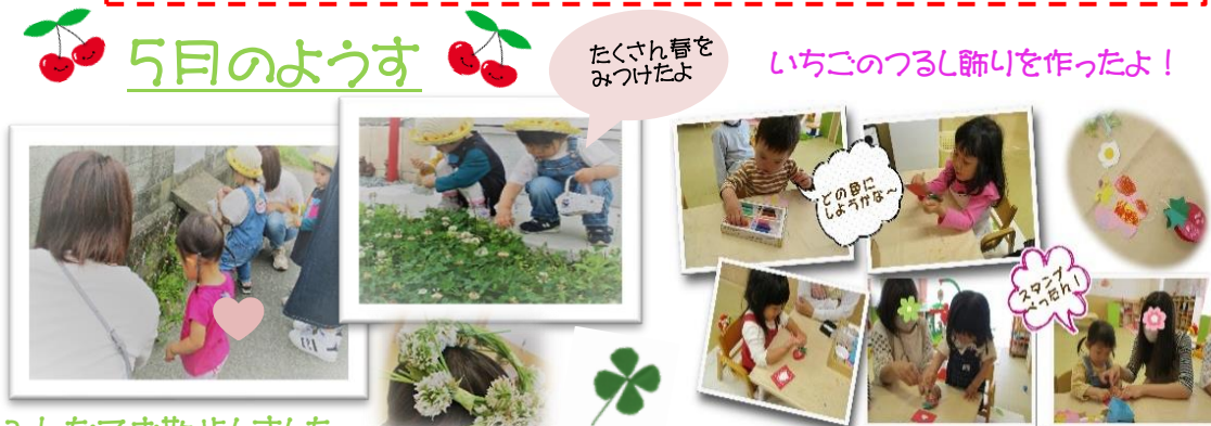
みんなでお散歩しました