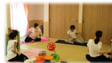
☆ヨガ講座☆ ママモリフレッシュ♥ 気持ちよかったですね~