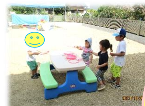
しゃぼん玉で遊んだよ♪ & ママと一緒に 「じゃんけんぽん」 & 10月ハロウィン製作 & お友だちと 一緒にお片付け☆