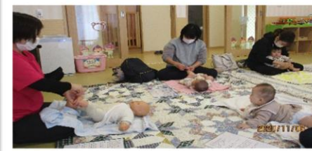
ベビーマッサージ 気持ちいい〜